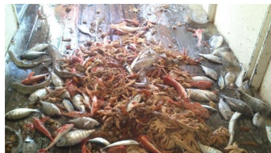
Captures faites lors d'un trait de chalut au cours d'une campagne de pêche scientifique sur le navire SPES.

La ressource halieutique sur la zone du projet fait l'objet de campagnes de pêche scientifiques au chalut et filets fixes. Un état initial de cette ressource, (quatre campagnes de pêche déjà réalisées) a permis de mettre en évidence un peuplement composé principalement de grondins, roussettes, émissoles, encornets, daurades grises et raies. Des campagnes de pêche scientifique seront réalisées pendant trois années après construction pour suivre les effets potentiels du parc.