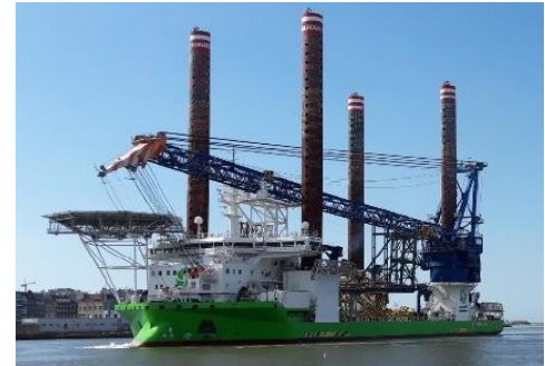
SEA INSTALLER / MMSI : 218781000