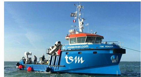
TSM PENZER / MMSI : 228076900