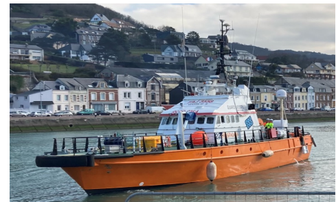
WORLD 3 / MMSI : 219013179